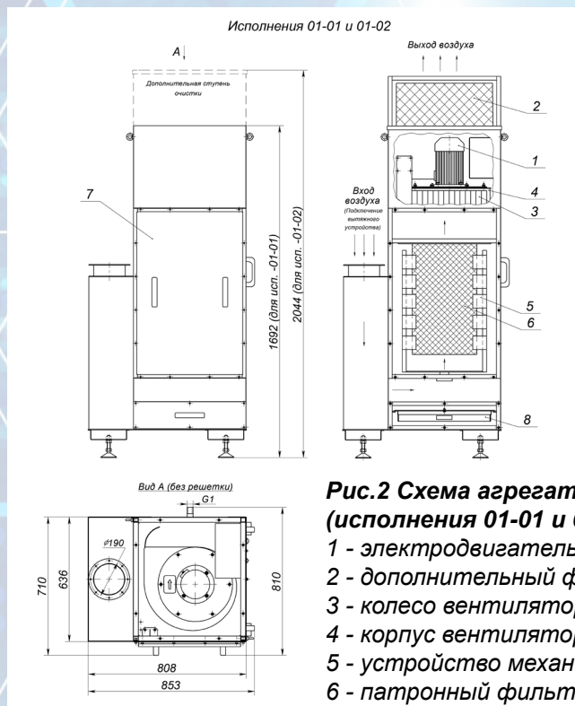
Рис.2 Схема агрегата ПАР-ПМ (исполнения 01-01 и 01-02)

При эксплуатации к агрегату могут подсоединяться различные консольно-поворотные устройства, воздуховоды от местных отсосов или другая вентиляционная сеть. Сопротивление указанных устройств не должно превышать запаса "свободного" давления, указанного в таблице.