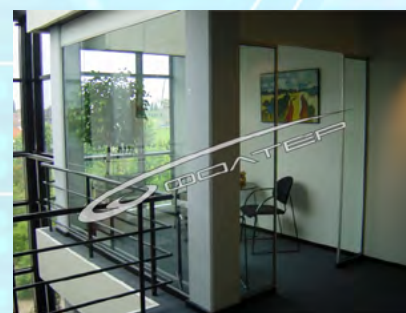
Встроенные в конструкцию помещения

Комнаты освещены и оснащены автоматикой, определяющей систему