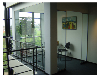
Встроенные в конструкцию помещения

Комнаты оснащены освещением и системой автоматики, определяющей присутствие курильщиков. По заказу могут изготавливаться комнаты других типоразмеров и другого дизайна. Системой очистки воздуха от табачного дыма могут быть оборудованы также существующие помещения (места) отведенные для курения. В этом случае разработка проекта системы очистки воздуха проводится по техническому заданию заказчика.