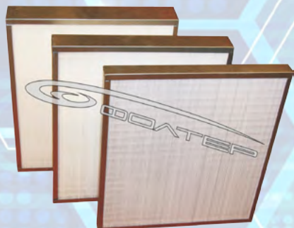
Рис.1 Фильтр ФяС-Ф-ПМП