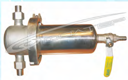
Рис.1 Фильтр ФСВ

Фильтры для очистки сжатого воздуха ФСВ повышают надежность и срок службы пневматического оборудования, станков и инструмента; улучшают качество лакокрасочных покрытий, получаемых методом пневматического распыления; обеспечивают более надежную и экономичную работу установок осушки воздуха; повышают качество продукции, в процессе изготовления которой используется сжатый воздух; увеличивают ресурс рукавных фильтров с импульсной регенерацией. Положительный эффект достигается за счет удаления из воздуха водомасляного тумана и твердых частиц размером более 0,3 мкм с эффективностью до 99,95 %, что обеспечивает 1...0 классы чистоты по ГОСТ 17433-80